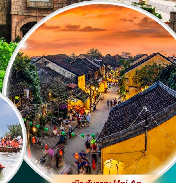
นั่งเรือกระด้ง Hoi An