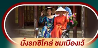
นั่งรถซิโคล์ ชมเมืองเว้