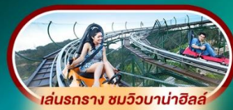
เล่นรถราง ชมวิวบาน่าฮิลล์