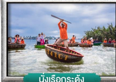
นั้งเรือกระดั่ง