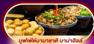
บุฟเฟ่ต์นานาชาติ บานาฮิลล์