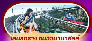
เล่นรถราง ชมวิวบานาฮิลล์