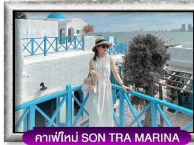
คาเฟ่ใหม่ SON TRA MARINA